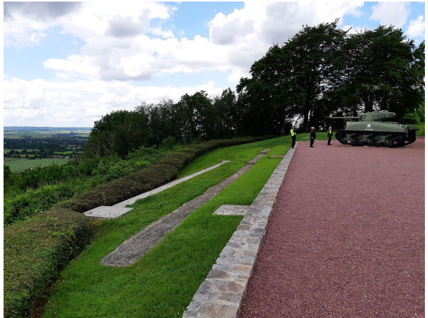
Een Sherman tank bij de Zak van Falaise