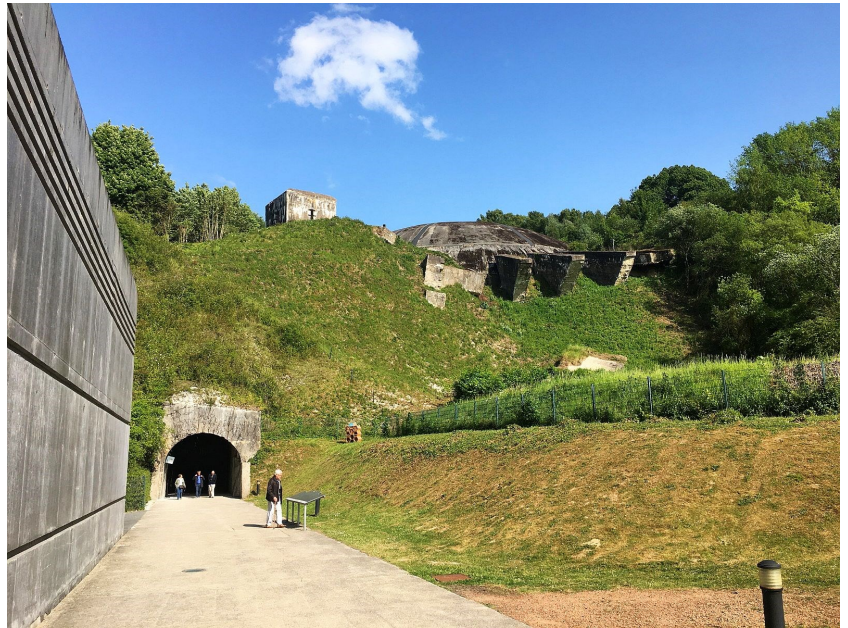
Museum La Coupole bij Saint-Omer

Op maandag gingen de meesten op stap. Een groep ging via de kust en dat bleek een goede keuze te zijn, want iedereen was enthousiast. Een andere groep is rechtstreeks naar Saint-Omer gereden, om daar het museum "La Coupole" te bezichtigen - een WW2-museum in een gigantische voormalige V2 fabriek. De volgende dag ging de rit naar Caen. Andere SkyRiders hebben ook hun weg naar Caen gevonden en dinsdagmiddag was iedereen "geland" in het hotel.