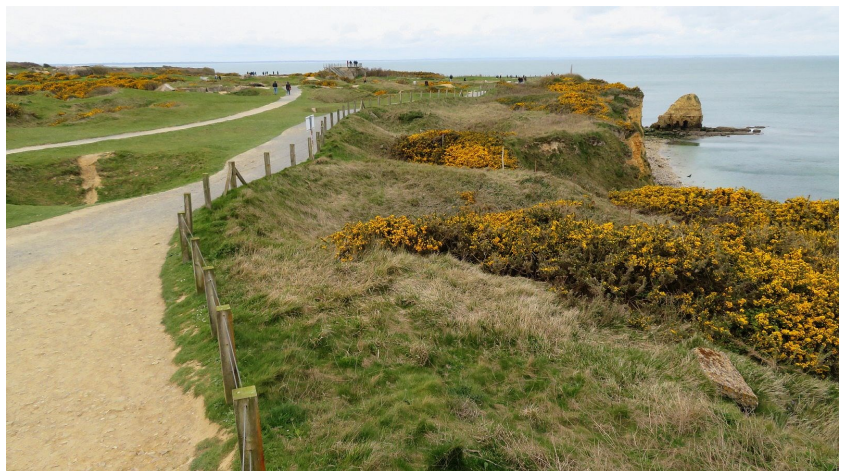
Point dus Hoc - op 5 juni niet te bereiken - in april wel

Zelf ben ik bezig gegaan met het uitzetten van de routes en dat bleek nog niet mee te vallen. Uiteindelijk zijn er diverse heen- en terugritten uitgezet: via de General Patton route, langs de kust en door het binnenland. De rondritten waren gedeeltelijk gericht op D-day: de invasie stranden, de ww2 overblijfselen in het noordelijk deel van Normandië en een rit door de zak van Falaise. Ook waren er twee routes uitgezet, die los stonden van D-day: een rondrit langs het riviertje de l'Orne en een rit naar de Mont St. Michel.