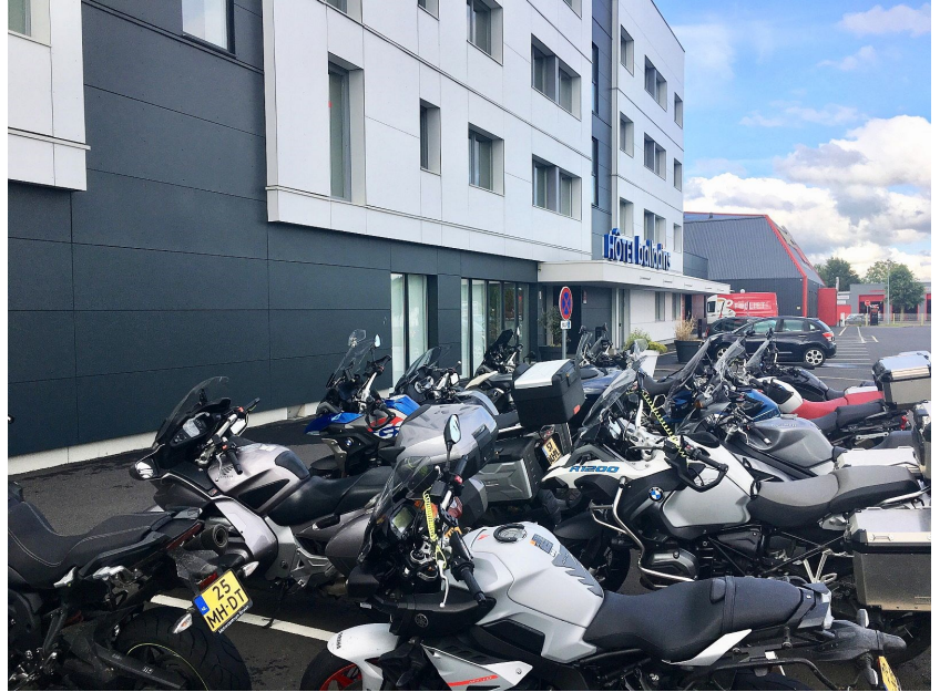
Hotel Balladins Caen Mémorial

Vandaar dat de inschrijving op de buitenland rit al vroegtijdig werd geopend en de 23 kamers waren snel bezet. Twee deelnemers op de reservelijst was toen het resultaat.