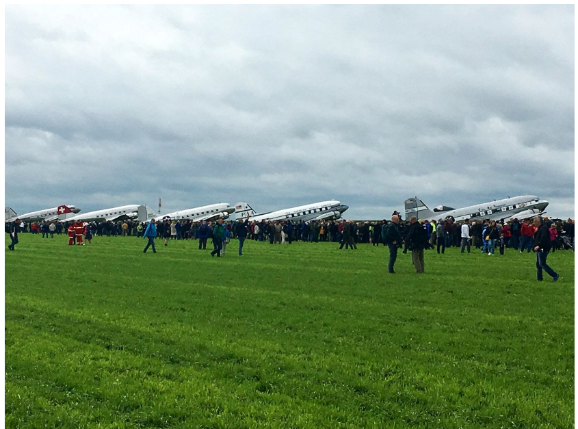
DC3's, opgesteld op het vliegveld van Caen